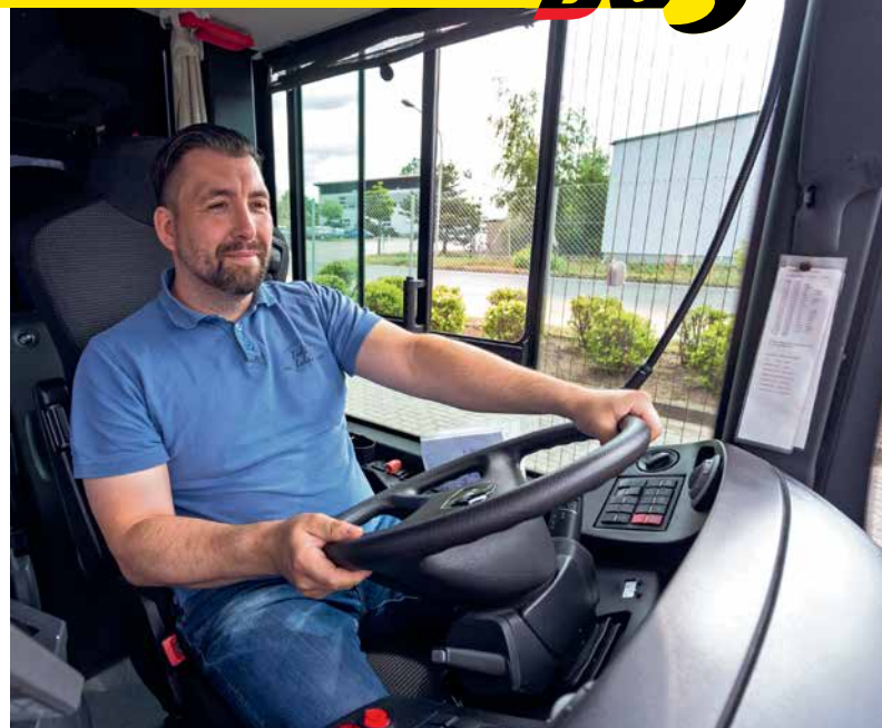
BUSFAHRER/-IN: MOBIL MACHEN

Wenn ein Fahrzeug liegenbleibt, ist der Fehler heute in 90 Prozent der Fälle in der Elektronik zu suchen. Entsprechend sieht der Job der Mechatronikerin bzw. des Mechatronikers bei uns aus: Mit sensibler Prüftechnik gehst du den Ursachen von Problemen auf den Grund und behebst sie, indem du Komponenten austauschst oder auch gezielt mechanisch eingreifst. Du gehörst also zu denen, die dafür sorgen, dass unsere Fahrzeuge einsatzfähig bleiben – oder es schnell wieder werden.