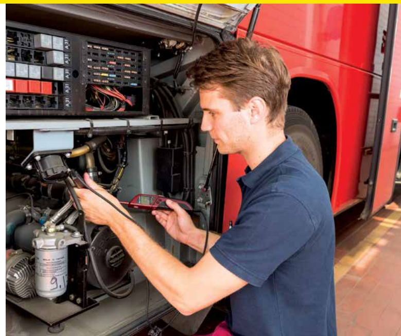
MECHATRIKER/-IN: MOBIL HALTEN